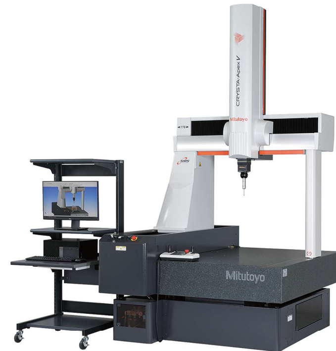
画像データ提供 株式会社ミットヨ